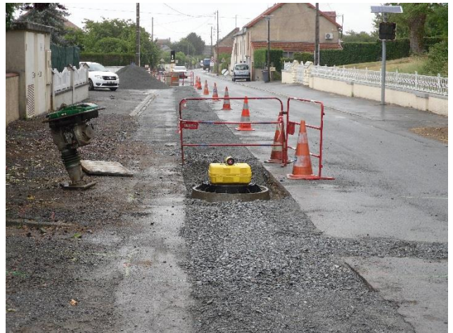
Branchement de l'assainissement Rue de la Patarianne