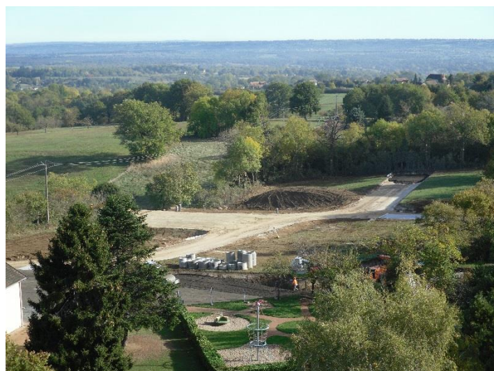
Avancement des travaux

D'ores et déjà l'avancement de ces travaux donne une idée précise de la zone médicale où d'autres constructions sont prévues (locaux ambulanciers, pharmacie et autres établissements paramédicaux).